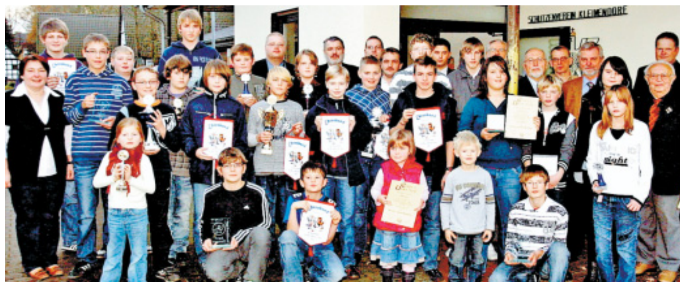
So sehen Sieger aus: Viele hoffnungsvolle Jungzüchter aus dem Lübbecke Land freuten sich am Samstagnachmittag über ihre Pokale und Preise, Medaillen und Ehrenbänder. Der Bezirksjugendvorstand und die Ehrengäste hatten die Siegerehrung vorgenommen.

Den Vereins-Wanderpokal gewannen in diesem Jahr die Nachwuchszüchter des RGZV Oberbauerschaft mit 475 Punkten. Auf den weiteren Plätzen folgten RGZV Sielhorst (474 Punkte) sowie RGZV Levern, RGZV Holsen und RGZV Rahden-Kleinendorf mit jeweils 472 Punkten.